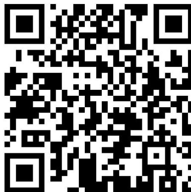
2016年黑龙江外国语学院跟踪报告